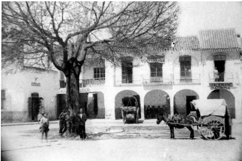
Plaza Mayor, en el Altillo. Detalle del mercado municipal en la primera mitad del siglo XX. En algunos periodos los puestos de venta llegaban a duplicarse mediante la colocación de carretas a las puertas del edificio que hacían las funciones de mostradores.

Aunque no hemos podido comprobarlo, puesto que los libros de actas del Ayuntamiento de Casas Ibáñez se han perdido, pensamos que pocos meses después llegó la autorización del Supremo Consejo permitiendo a las auto-