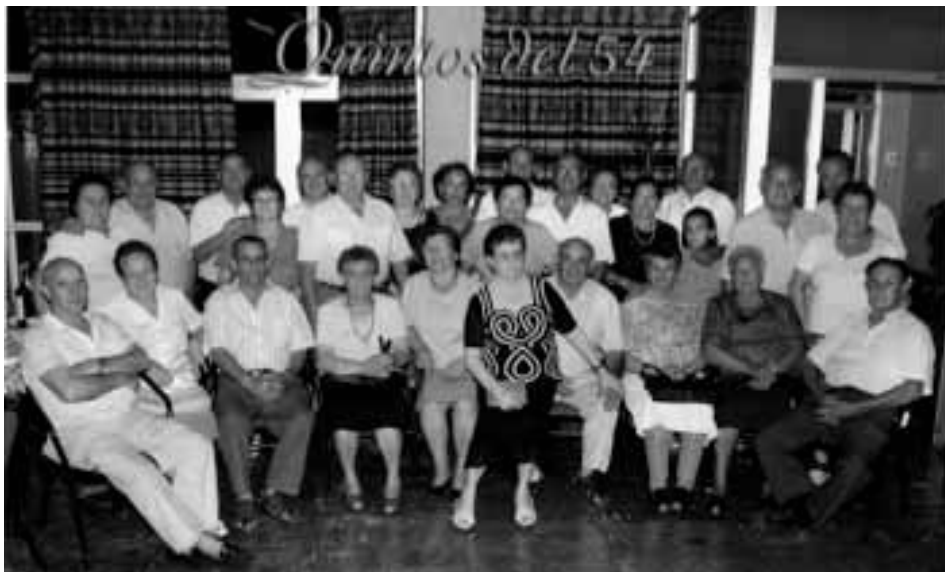
Cena de quintos y quintas de 1954 el día 8 de agosto de 2008 en el bar "el frontón"

Aprovechando la celebración de mi cumpleaños, quiero felicitar igualmente a todos mis quintos y mis quintas, tanto a los que ya han cumplido los años como a los que han de cumplirlos en lo que queda de 2013, deseándoles lo mejor y que celebren sus 80 cumpleaños, pasándolo bien y acompañados de sus respectivas familias.