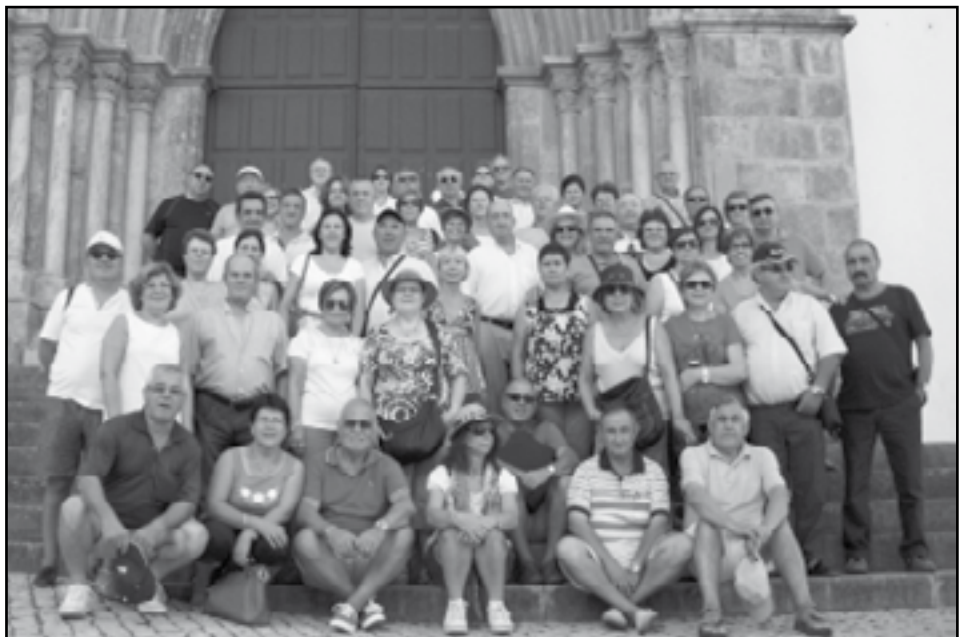
Viaje al Algarve y Huelva. Del 31 de agosto al 6 de septiembre Cincuenta y cuatro personas fueron las que disfrutaron de este espléndido viaje en el que se visitaron lugares como Albufeira, Lagos, Carvoeiro, Praia da Rocha, Sagres, Cabo de San Vicente, Faro, Silves, Ayamonte, Punta Umbria, Mazagón, Palos de la Frontera, Huelva, Moguer, Monasterio de la Rábida, Ermita del Rocío y Parque de Doñana.

pic asesores FISCAL • LABORAL • CONTABLE