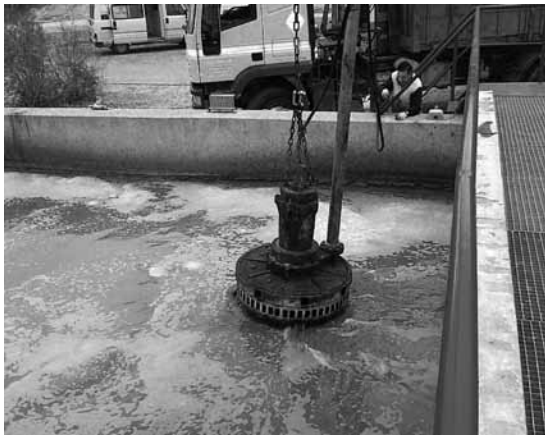
Operación de limpieza y mantenimiento de la depuradora el pasado mes de abril

Desde el pasado mes de Noviembre (2013), la gestión de la Estación Depuradora de Aguas Residuales de Casas Ibáñez ha sido asumida por el Ayuntamiento con el fin de reducir gastos de gestión y optimizar las operaciones en estas instalaciones de gran importancia ambiental. Si bien, la contaminación de aguas que genera el municipio ha aumentado sobre todo en lo referente a la industria, principalmente vinícola.