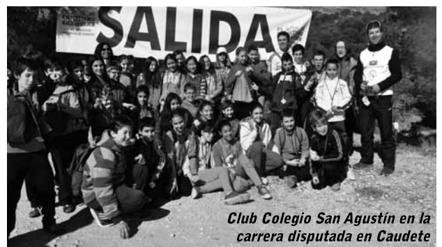
Club Colegio San Agustín en la carrera disputada en Caudete