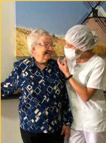
Una residente comparte una anécdota con un miembro del equipo SERCOAMA