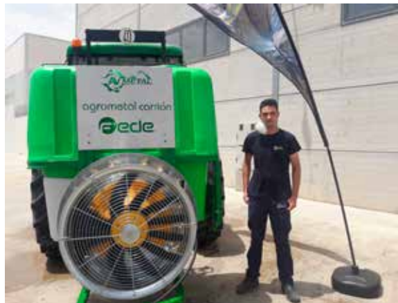
Atomizador adquirido por el Ayuntamiento

oficina en nuestro Centro Social con el fin de promover el emprendimiento, el empleo y la formación en nuestro municipio, así como facilitar las gestiones a sus usuarios y afiliados. Para la recién creada Asociación "Ibañeses Solidarios" se destinarán 5.000 euros, importe que destinarán para hacer frente a necesidades de extrema urgencia como consecuencia del Covid-19, o bien para proyectos solidarios tal y como ya se hizo en las pasadas Navidades. También se destinarán 1.000 euros a la Asociación protectora de gatos, que si bien este importe nos resulta insuficiente hay que tener en cuenta que es el primer año que reciben ayuda municipal, y que en un futuro se estudiará ampliar su dotación. Ya para terminar, en el apartado de Inversiones Reales se destinarán 56.055,45 euros (1,41%) del gasto total del presupuesto. Dicho importe se destinará a la construcción de nichos en el Cementerio Municipal, pues llevamos años sin que se construyesen y estamos al 100% de