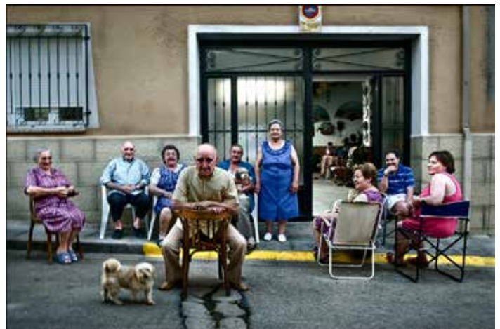
Con Diez Basta!

En próximos números de este Informativo, seguiremos dando a conocer fotografías de estos artistas y también de aquellos otros que queráis colaborar, bien dentro de este campo de la fotografía, bien en otros de las Bellas Artes: dibujo, pintura, escultura, comic, diseño, etc.