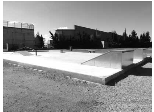
Pista de Skate Park