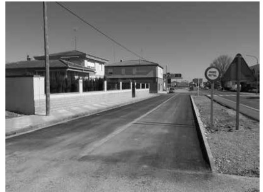
Pavimento en el paseo del Instituto