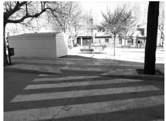
Mejora de la accesibilidad